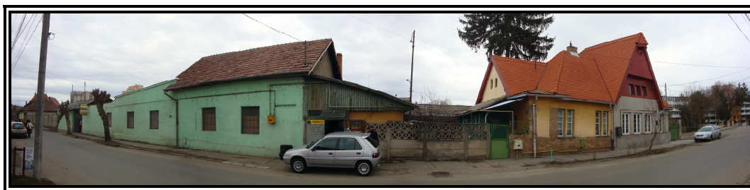
Desfășurare a frontului stradal. În centru, clădirile propuse spre demolare (str. Furnicilor nr. 1A), iar în stânga locuința de pe strada Furnicilor nr. 1 proaspăt renovată.

Activitățile actuale (depozit comercial) nu sunt poluante, însă ținând cont de aspectul estetic al construcțiilor existente se poate vorbi de o poluare vizuală.